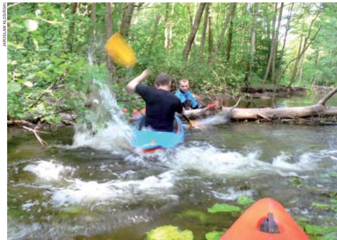
Płonia miejscami przypomina słynną Drawę

- Tylko w miesiącach wczesnowiosennych. Później Płonia płynie dość leniwie, każdy sobie na niej poradzi.