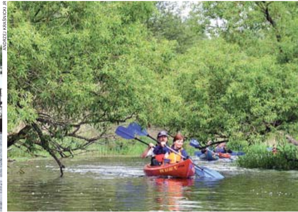
Płyniemy przez służę...