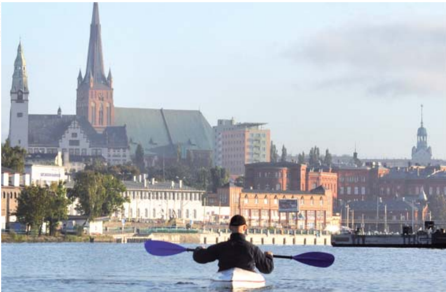
Widok na Szczecin z perspektywy kajaka. Ilu mieszkańców zna miasto od tej strony?