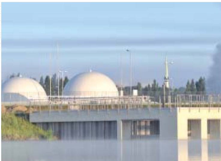
Oczyszczalnia ścieków Pomorzany. W tym miejscu do rzeki wpada czysta woda

Jedyny taki most w Polsce. Wciąż działająca zwodzona przeprawa kolejowa nad Regalicą k. Podjuch. 163-tonowe przesło unosi się, by przepuścić większe statki. Most to odbudowana po zniszczeniach wojennych niemiecka konstrukcja (na amerykańskim patencie). Na 17-metrowym przesłach jest tylko atrapa trakcji. Pociągi elektryczne przejeżdżają ten odcinek rozpędem.