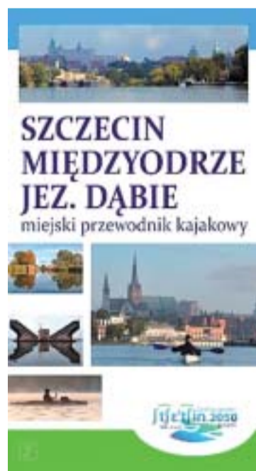
Okładka przewodnika dla kajakarzy

Całość wydana została na specjalnym, wodoodpornym materiale. Przewodnik wydało Wąlkowska Wydawnictwo. Kosztuje 34,90 zł. ●